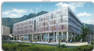
서울대학교 38동 글로벌공학교육센터 4층 EPM 교육장