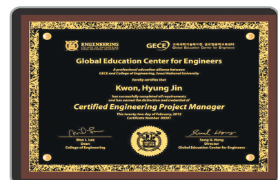
▲ CEPM : Certified Engineering Project Manager