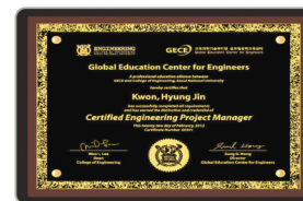
▲ CEPM : Certified Engineering Project Manager