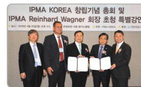
▲ 세계PM협회(IPMA) Korea와 협력 체결