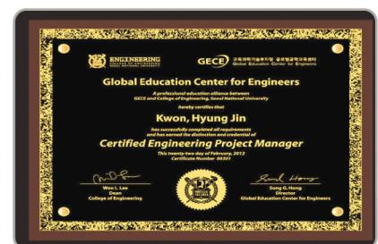
▲ CEPM : Certified Engineering Project Manager