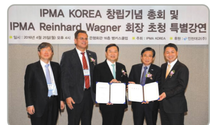
▲ 세계PM협회(IPMA) Korea와 협력 체결