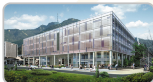
서울대학교 38동 글로벌공학교육센터 4층 EPM 교육장