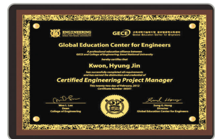
▲ CEPM : Certified Engineering Project Manager