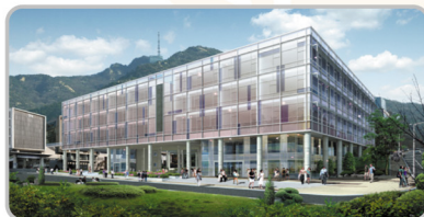
서울대학교 38동 글로벌공학교육센터 4층 EPM 교육장