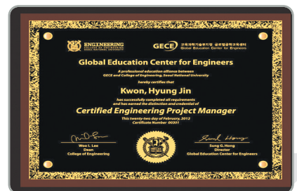
▲ CEPM : Certified Engineering Project Manager