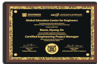
▲ CEPM : Certified Engineering Project Manager